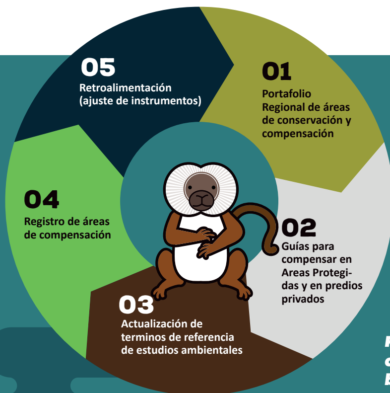
Figura 3. Estrategia de compensaciones a la biodiversidad del Atlántico - Fase 1