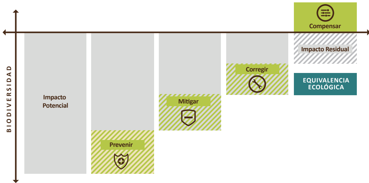
Figura 2. Procedimiento para aplicar el portafolio en la elaboración del estudio de impacto ambiental y plan de compensación.

"Adaptado de WRI (2013), Temple et al, (2012)"